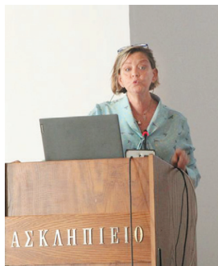
Εικ. 10: Η κ. Στουφή στο βήμα