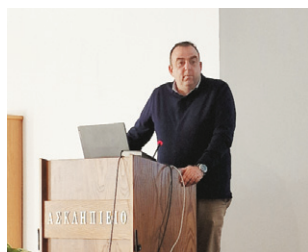
Εικ. 7: Ο κ. Αγρανιώτης στο βήμα