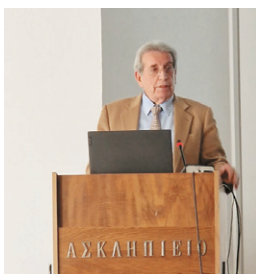
Εικ. 8: Ο Καθ. κ. Μπεχράκης στο βήμα